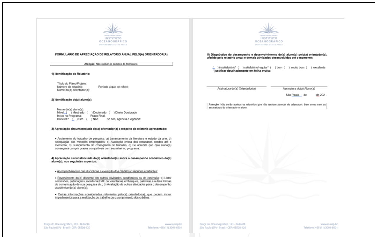
FIGURA 2: MODELO DE FORMULÁRIO DE APRECIÇÃO DE RELATÓRIO ANUAL PELO(A) ORIENTADOR(A) DISPONÍVEL NO SITE DO IOUSP.